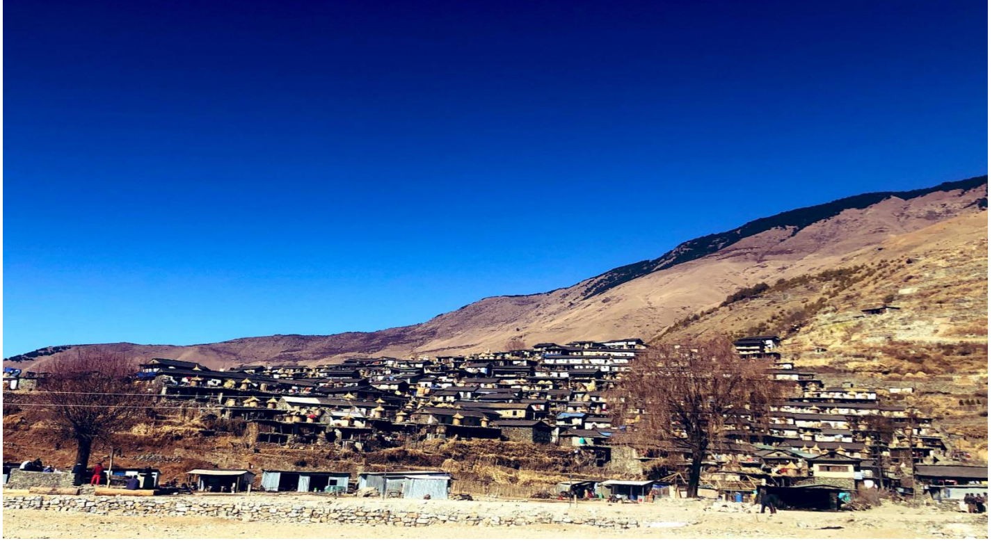
पुथा उत्तरगंगा गाउँपालिका तकसेरा बस्ती