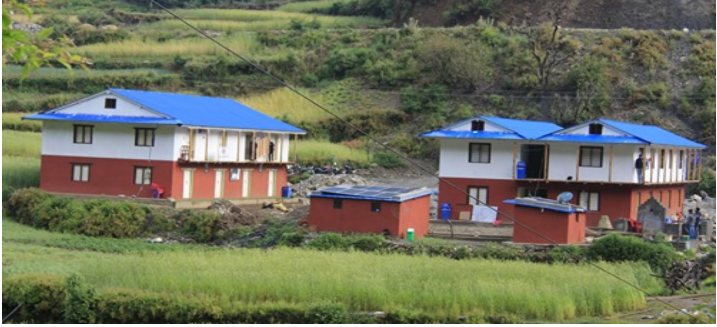
भुमे गाउँ कार्यपालिकाको कार्यालय, खावाडवगर